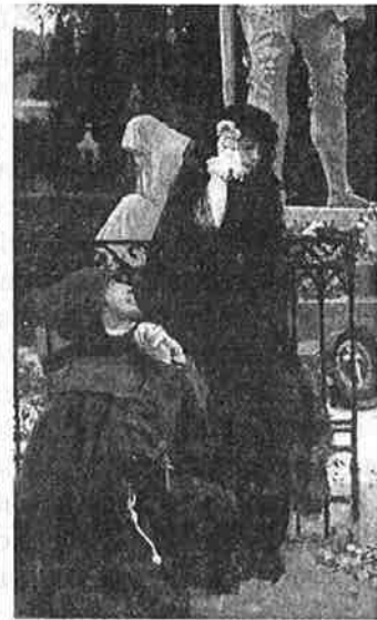
Рис. 2. И.Е. Репин «Дон Жуан и донна Анна»

от себя в пользу видимости. Однако, для Зевса соблазн остаётся только одной из возможных практик, имеющих статус забавы и развлечения; после достижения очередного любовного успеха бог «приходит в себя» и продолжает привычное существование.