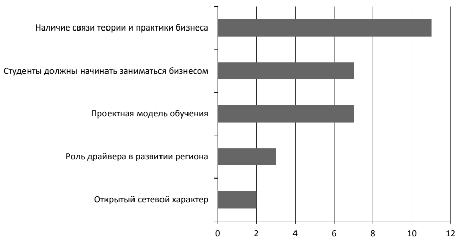
Рис. 3. Отличия предпринимательского университета от других вузов (число выборов) Fig. 3. Distinctions of an entrepreneurial university from other universities (number of elections)

онного клуба предпринимателей, оказание консультаций, дополнительное образование, институт менторства и другие форматы.