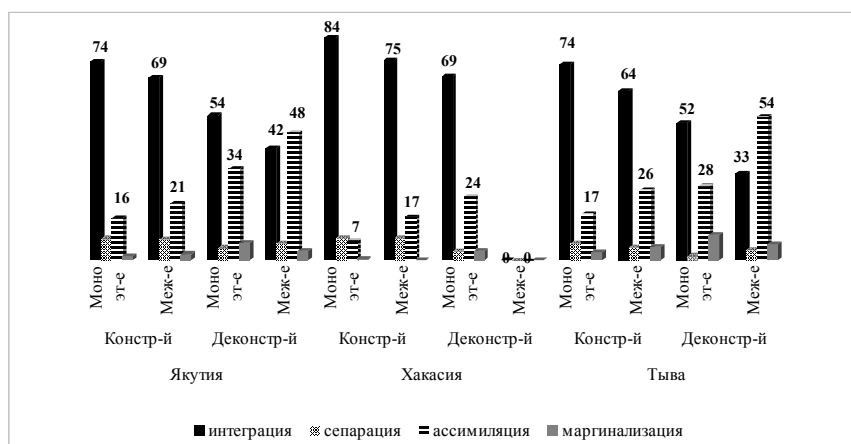
Рис. 3. Влияние социокультурного типа семьи (конструктивного и деконструктивного) на выбор аккультурационной стратегии молодежью, % в группе

Материалы социально-психологического опроса молодежи позволили выявить существующую закономерность постепенного снижения стремления к выбору интеграционной стратегии у молодежи – от моноэтнической к межэтнической семье – в зависимости от стремления к сохранению родителями традиций и поддержания позитивного эмоционального фона. И наоборот, уменьшение значимости сохранения связей с этнокультурными истоками, ухудшение взаимопонимания и тяготение к конфликтным ситуациям в семье – от моноэтнической к межэтнической семье – продемонстрировало усиление тенденции у молодежи к выбору ассимиляционной стратегии.