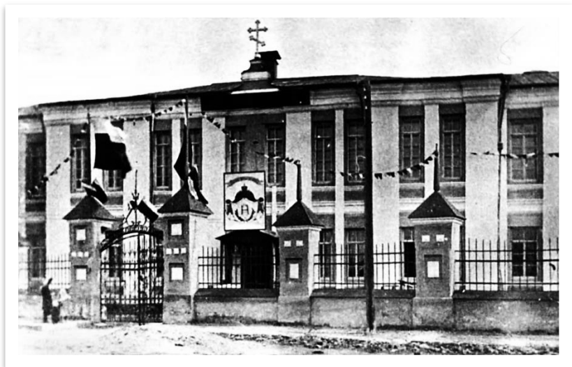
Фото 6. Здание реального училища [209]

разreshалось учреждение одноклассных и двухклассных училищ. В учебный план училищ был включен родной язык как обязательный предмет. Разreshалось преподавание других предметов на родном языке учащимся первых двух лет обучения [255].