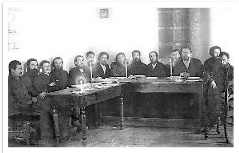
Фото 9. Заседание членов Сибиряковской экспедиции [105, с. 166]

По окончании поселения в 1905 г. выехал в Петербург. Здесь с 1905 по 1910 гг. работал в этнографическом отделе Русского музея, в 1914–1917 гг. – секретарь отделения этнографии Русского географического общества, сотрудничал в журнале «Живая старина». Работал в Музее антропологии и этнографии, состоял членом комиссии по изучению Якутии. В 1927 г. избран членом-корреспондентом Академии наук СССР, в 1931 г. – почетным академиком. В последние годы жизни работал в Институте востоковедения АН СССР [273, с. 244–245].