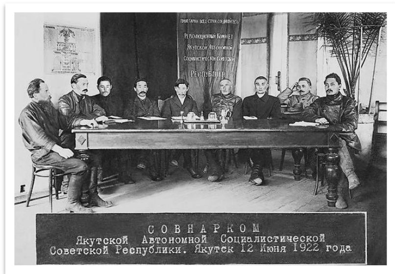
Фото 12. Первый совнарком Якутской АССР. 12 июня 1922 г. [20; 251]

◆—————◆ формировать автономную государственность в европейском понимании, поскольку понятие «советская автономия» к тому периоду теоретически было не разработанным [46, с. 14; 124, с. 128; 140].