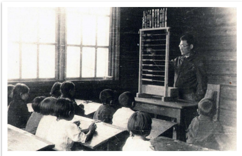
Фото 19. Урок арифметики [89]

◆ ————— ◆ техникумов. В те годы начали обучение два рабфака и несколько техникумов: два педагогических, медицинский, горный, дорожный, финансово-экономический, полеводческий, потребительской кооперации, рыбного хозяйства, пушной и речной.