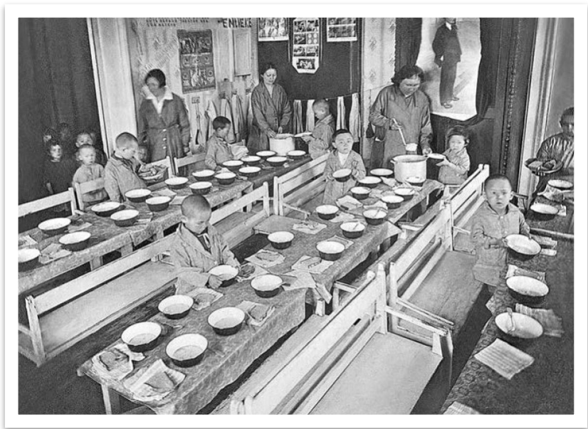
Фото 15. Детский сад. 1920-е гг.. [42; 252]

◆ ————— ❧ ————— ◆ отходничество в город. Для борьбы с отсталостью женщин предполагалось обучать их в специальных школах и втузах, на курсах, так как процент обучающихся колхозниц был чрезвычайно низок. Правления многих колхозов не могли уговорить женщин выехать на учебу. Случалось, что на курсы, рассчитанные специально на женщин, колхозы вынуждены были направлять мужчин. Для руководителей колхозного движения становилось совершенно очевидным, что для того, чтобы женщина поднимала свой образовательный и профессиональный уровень, необходимо создать ей определенные бытовые условия, прежде всего путем организации сети дошкольных учреждений.