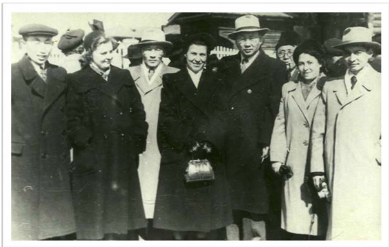
Фото 21. Первые преподаватели ЯГУ [104]

В создании учебно-методической базы университета и библиотеки помогали многие вузы страны, в том числе Московский, Ленинградский, Иркутский, Киевский государственные университеты, Московский геолого-разведочный и Московский инженерно-строительный институты и другие.