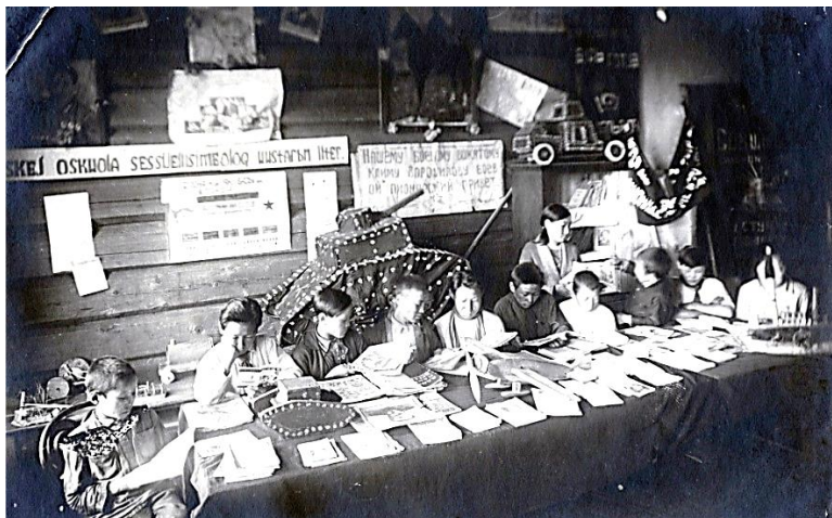
Фото 14. Дети за чтением [39].

◆—————❧—————◆ в 1930–1931 гг.. С 1931–1932 уч. г. было введено всеобщее обязательное начальное обучение для детей 8–10 лет и переростков, а также семилетнее обязательное обучение.