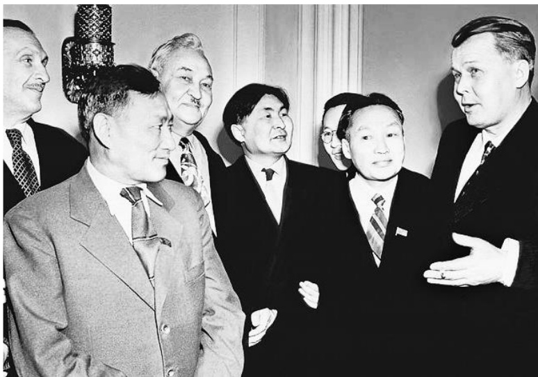
Фото 20. А.Т. Твардовский (1-й справа) беседует с якутскими писателями во время открытия декады якутской культуры в Колонном зале Дома Союзов. 1957 г. Источник: б/н. РГАКФД [106, с. 364].

◆ ————— ◆ литературы и искусства в Москве и Петербурге, а затем Дней русской, казахской, киргизской и других литератур в Якутии, продолжается до сегодняшнего дня [48].