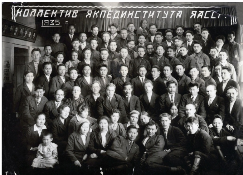
Фото 18. Коллектив Педагогического института, 1935 г. [89]

В 1935 г. прием на подготовительное отделение был увеличен до 110, в 1936 г. – до 150 человек. Расширение структуры пединститута в 1935 г. совпало с организацией Института языка и культуры, в результате чего было открыто отделение русского языка и литературы. С 1935–1936 уч. г. начало работать заочное отделение.