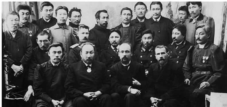
Фото 8. Э. К. Пекарский на съезде представителей улусов, 1902 г. [268]

революционной литературы и участие в студенческих беспорядках в Харьковском ветеринарном институте к 15 годам каторжных работ, замененных после ссылкой «на поселение в отдаленные места Сибири с лишением всех прав и состояния».