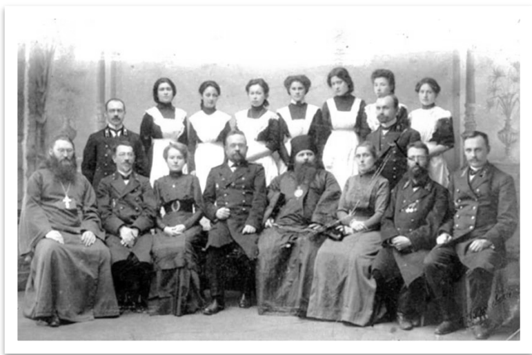
Фото 3. Выпускницы Якутской женской гимназии, 1911 г. 2

Окончившим полный курс гимназии давалось право поступать на высшие женские курсы, в институт благородных девиц, на педагогические и медицинские факультеты университетов.