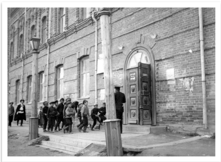
Фото 11. Ученики посещают библиотеку [276].

в которой изложил мысли о необходимости создании ЯОРГО: «... знания о Якутской области стоят далеко значительно ниже того уровня, чем на каком они могли бы быть в действительности. Причина такого явления лежит в том, что в области до сих пор не было общего объединительного центра, который бы, если и не руководил деятельностью исследователей, но все же объединял бы эту деятельность, устанавливал бы связь и был бы хранителем добытого.