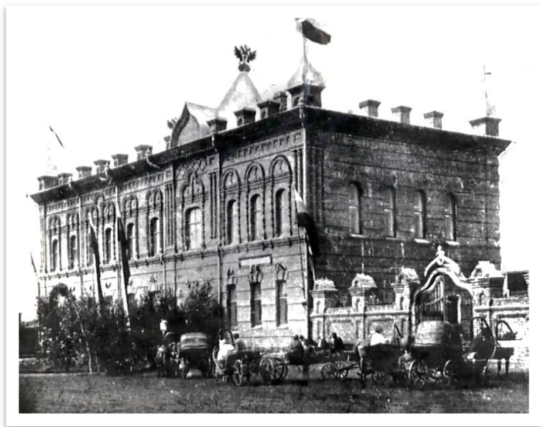
Фото 10. Здание музея и библиотеки [275].

Автором проекта здания музея был К. А. Лешевич. Заведывание постройкой здания приняло на себя Правление общества попечения о народном образовании. Во дворе музея была устроена метеорологическая станция 2 разряда 1 класса, оборудованная всеми необходимыми инструментами и приборами. На станции проводились систематические наблюдения.