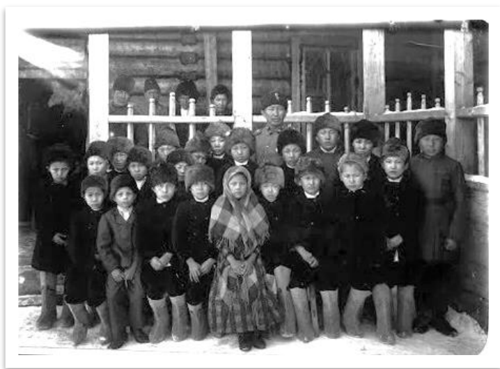
Фото 1. Ученики церковно-приходской школы [277]

деятельность первое учебное заведение в Олёкминске. При нем был открыт пансион на 10 учеников. Училище находилось сначала в ведении олёкминского комиссариата, а потом исправника. Учителями работали полуграмотные и грубые люди. Уже через два года богатые родители стали забирать детей из школы. Из 17 учеников посещало школу 7. Еще через год – в 1815 г. – дети совсем перестали посещать школу. Дело дошло до того, что по указанию комиссара за учениками посылали казака. Учеников, пропускавших занятия, наказывали «по существующим правилам».