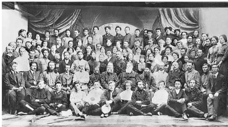
Фото 7. I съезд учителей народных училищ Якутской области. 1 августа 1914 г.