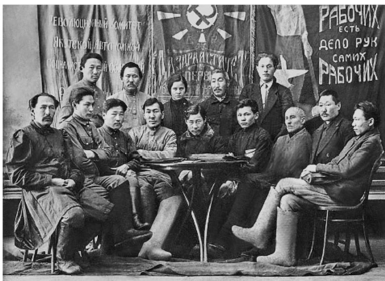
Фото 13. Президиум I Учредительного съезда Советов Якутской АССР. 27 декабря 1922 – 19 января 1923. [106, с. 129; 251]

◆ ————— ◆ состава Советов. По национальному составу якутов насчитывалось 53, русских – 37 и прочих – 8. По профессиональному составу рабочих было 13, крестьян – 15, интеллигенции – 54, военных – 11 и прочих – 5 чел. Численность лиц интеллектуальных профессий в два раза превышала число пролетариев и крестьян. По образовательному цензу делегаты распределялись следующим образом: с высшим образованием – 1, с неоконченным высшим – 7, специальным – 3, средним – 16, неоконченным средним – 19, низшим – 38, домашним – 13 и неграмотных – 1 чел. По уровню образованности более половины делегатов имели лишь начальное и домашнее образование [19, с. 30; 143].